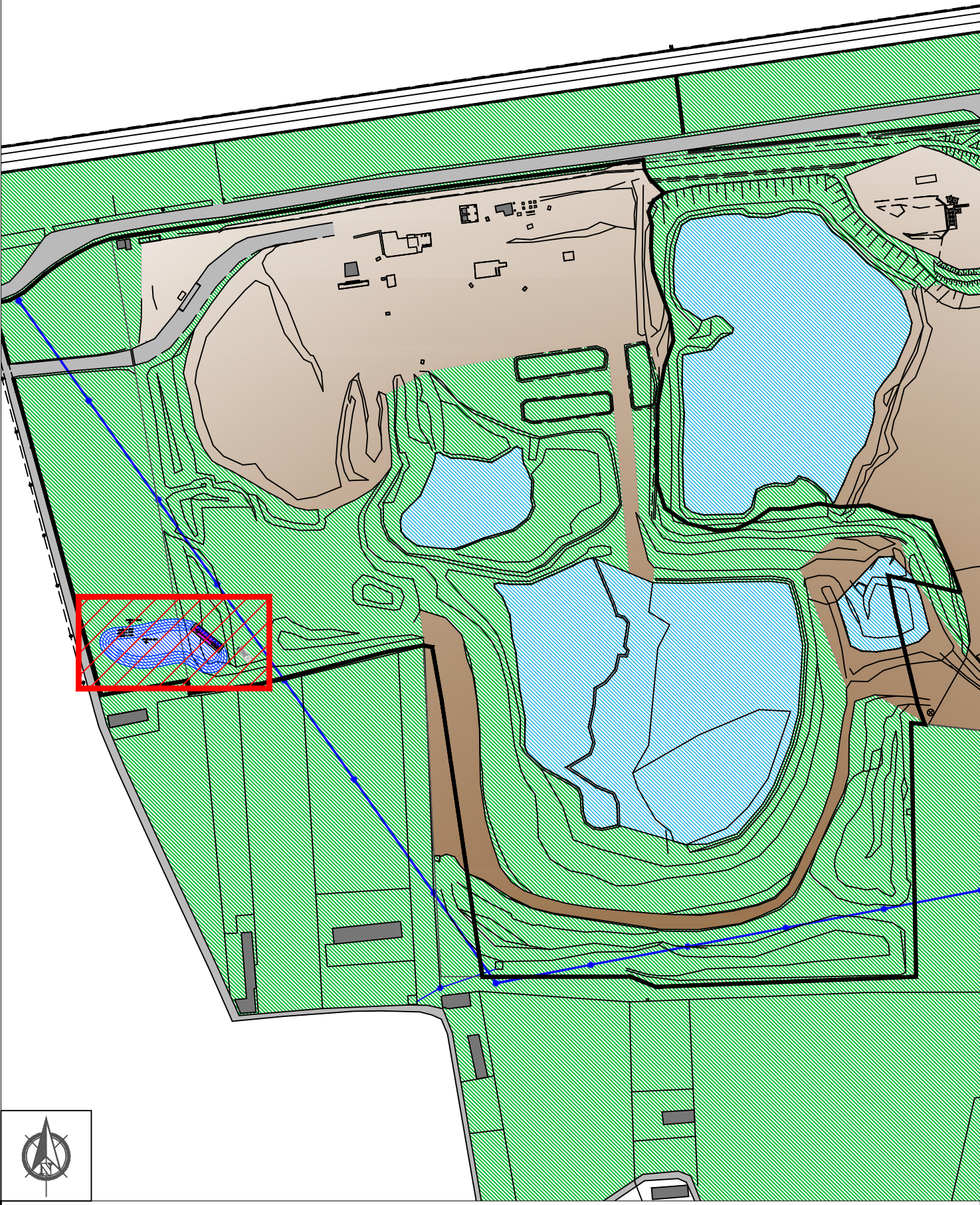
Area di intervento