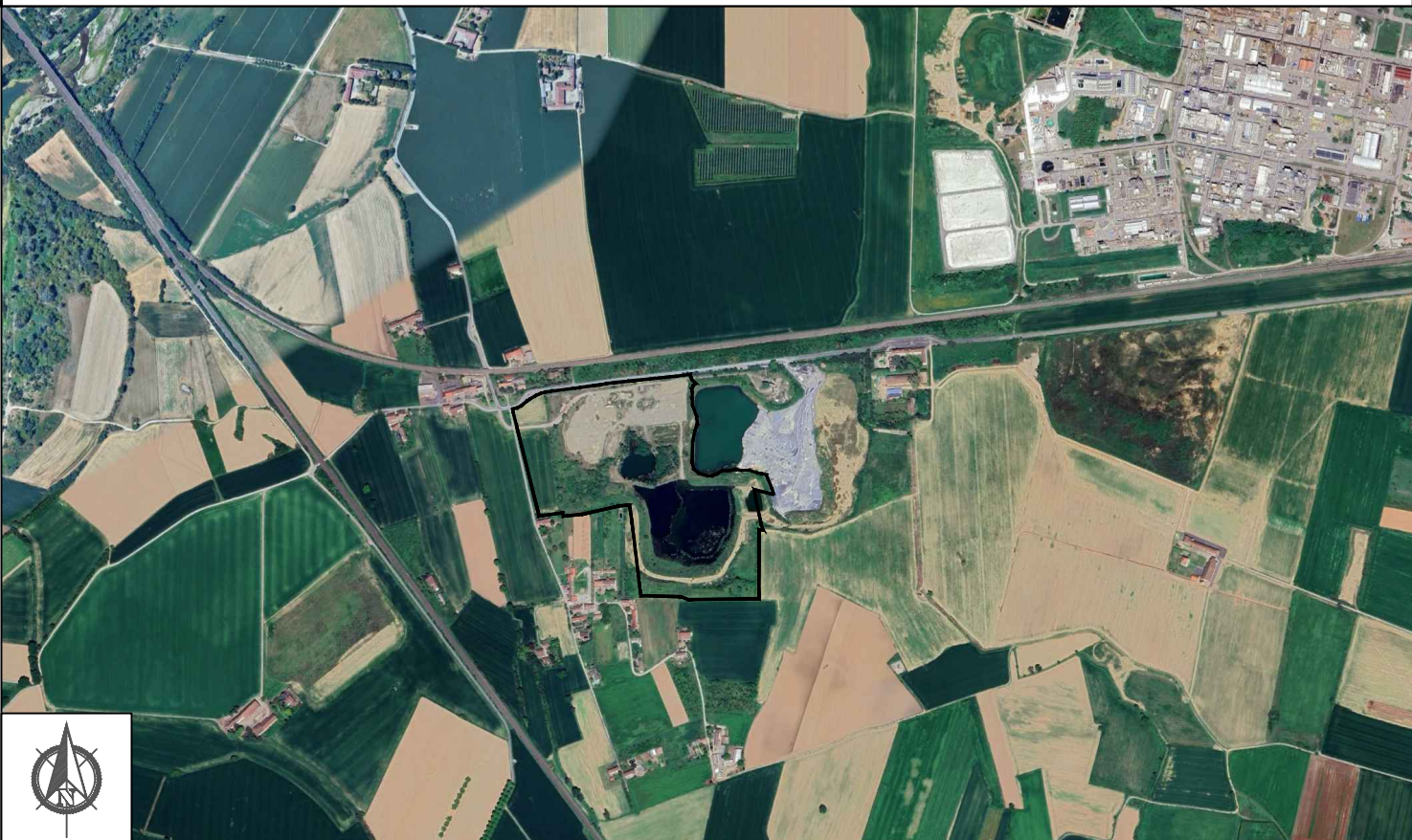
Confine di proprietà

SILPDUE s.r.l. AB Green s.r.l. CAVA LA BOLLA - ALESSANDRIA